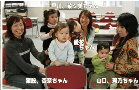
仕事が手につかなかったのですが、楽しいひとときでした。