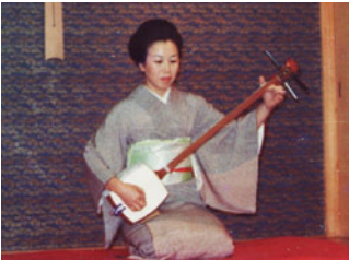
35才、三味線と小唄を極めました。