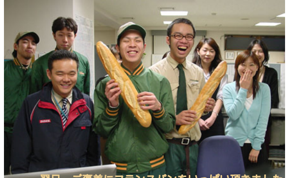
翌日、ご褒美にフランスパンをいっぱい頂きました。