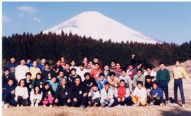
'95年まで20年続いた富士倫理学苑研修