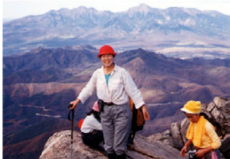
数々の山を征服しました。