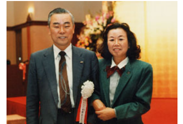
同上 ダスキン本社、下野専務と