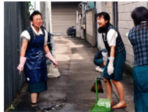
環境整備で店外清掃、平成7年