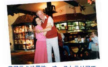
コアラより男性、オーストラリアで