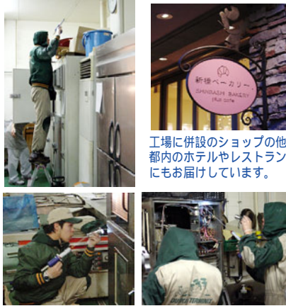
工場に併設のショップの他都内のホテルやレストランにもお届けしています。