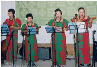
昨年のウクレレ発表会でハワイアン