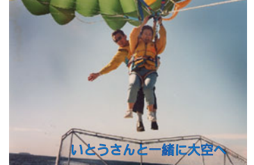
いとうさんと一緒に大空へ