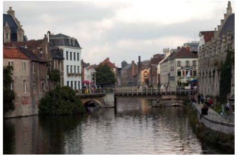
運河の街ブルージュ