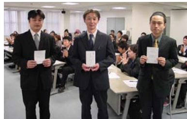
11月26日のサイクル勉強会で、皆さんから祝福を受けました。