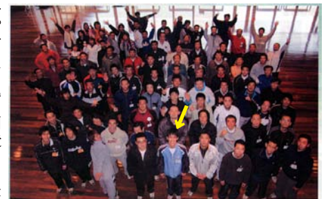
ロビーに全員集合。正面中央が私です。

父にしてもらったことは少ないです。ただ一つあげるとするならば、一歳の時に別居して以来約20年に渡り仕送りをしてくれた事です。この事実を知ったのは高校に入学した頃だっと思