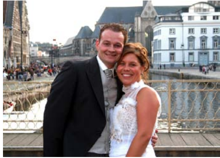
結婚式の後は街を練り歩いてご披露するのが慣わし